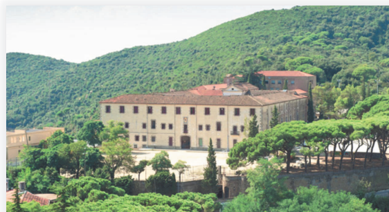
CASA DE COLÒNIES LA CONRERIA

AQUESTA ACTIVITAT NO ESTÀ OBERTA A JUGADORS QUE NO SIGUIN DEL C.B.MOLLET