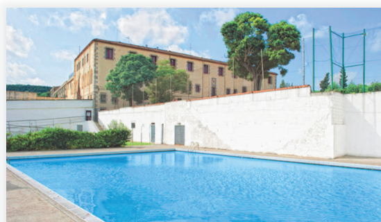
PISCINA I ZONA D'AIGÜES